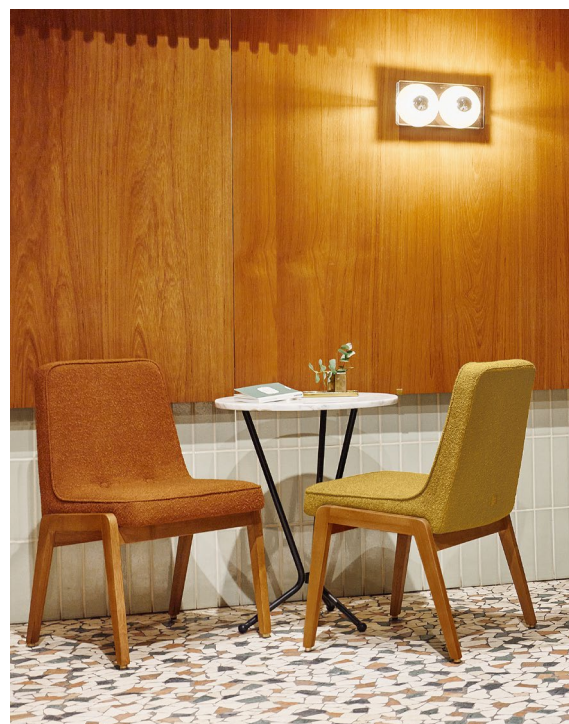
200-125 VAR Chairs / Chaises – Boucle Coll. / Mustard & Sierra