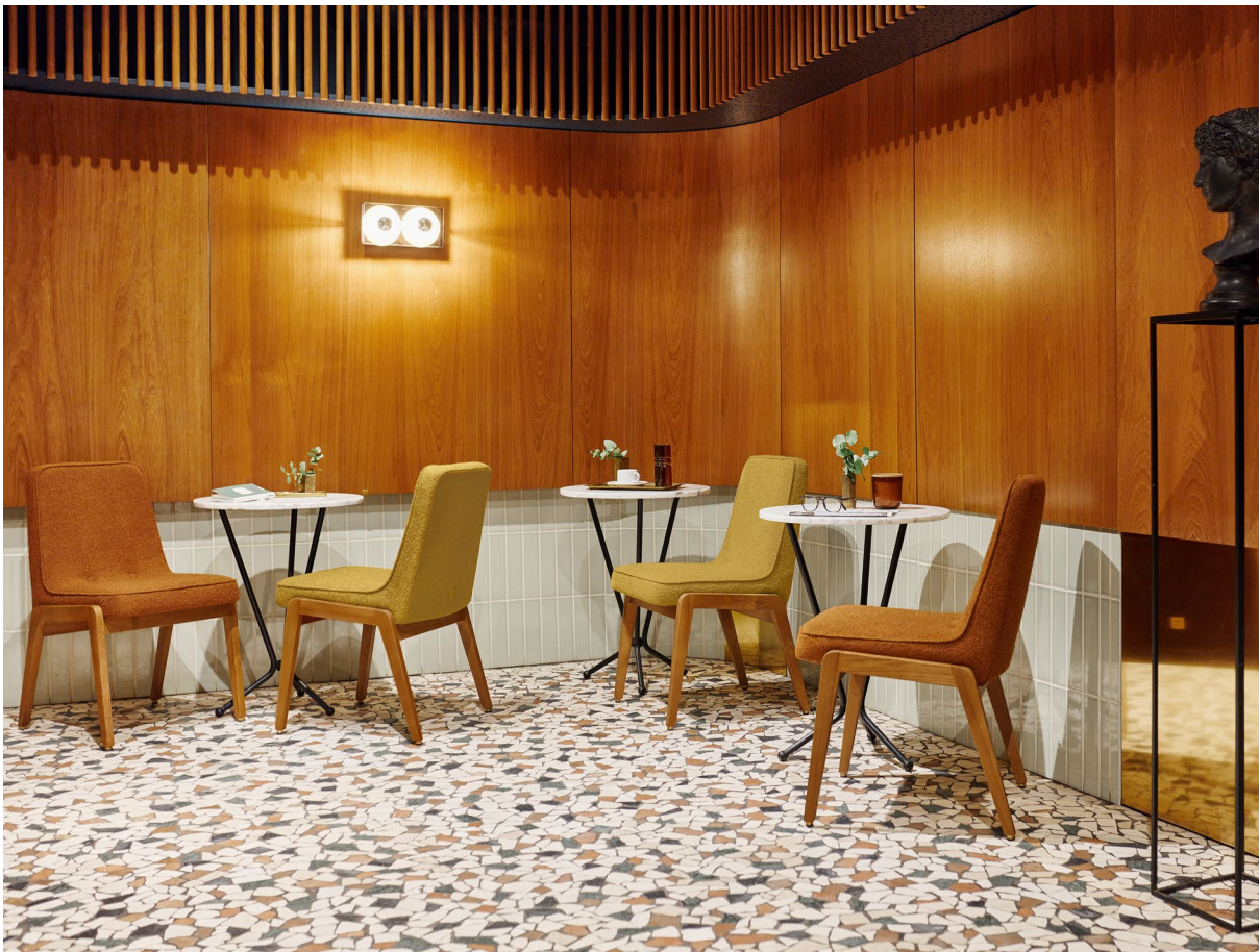
200-125 VAR Chairs / Chaises – Boucle Coll. / Mustard & Sierra